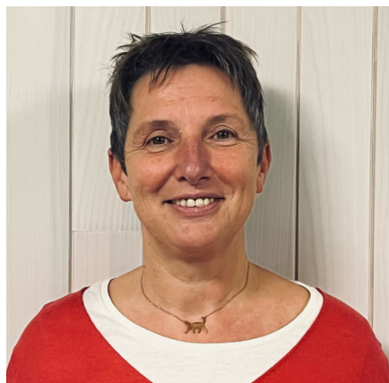
Cheffe de Service